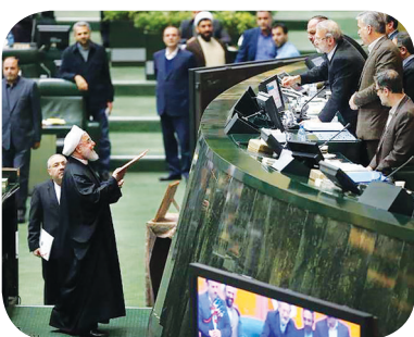
معیشت کارگران آن پروژه یا صنعت روی دهد.

معیشت کارگران آن پروژه یا صنعت روی دهد. عضو کمیسیون عمران مجلس شورای اسلامی گفت: یکی دیگر از ویژگی‌هایی که بودجه سال ۹۸ دارد این است که دولت در زمان مناسب بودجه را به مجلس ارائه کرد و همین موضوع باعث شده تا کار بررسی در کمیسیون‌های مجلس بدون عجله انجام شود و هر اتفاق جدیدی که برای بودجه رخ دهد نیز به مردم اطلاع‌رسانی خواهد شد که این موضوع کمک شایان توجهی به شفافیت در بودجه سال ۹۸ می‌کند. اعضای اضافه کرد: رویکرد مجلس نیز به این‌سو است که شفافیت در بودجه وجود داشته باشد. رئیس‌جمهور سه‌شنبه چهارم دی ۹۷ در صحن علنی مجلس شورای اسلامی حاضر شد و لایحه بودجه ۱۳۹۸ را با سقف ۱۷ میلیون ۳۲ هزار و ۳۳۲٫۲۷۰٫۰۰۰ (۱۷۰۳۲۳۳۲۲۷۰۰۰۰۰) تقدیم کرد. کاهش تهدیدهای ناشی از تحریم‌های ظالمانه آمریکا، افزایش تاب‌آوری اقتصاد ایران و دستیابی به اهداف موردنظر در برنامه ششم توسعه از ویژگی‌های لایحه بودجه ۹۸ بیان‌شده است. کمیسیون‌های تخصصی مجلس موظف هستند حداکثر تا ۱۵ روز پس از چاپ و توزیع لایحه، گزارش خود را به کمیسیون تلفیق تقدیم کنند و کمیسیون تلفیق نیز موظف است حداکثر ظرف ۱۵ روز پس از پایان مهلت گزارش کمیسیون تخصصی، ضمن رسیدگی به گزارش کمیسیون‌های تخصصی، گزارش نهایی خود را تنظیم و به مجلس شورای اسلامی تقدیم کند. مهلت رسیدگی کمیسیون تلفیق حداکثر تا پانزده روز با موافقت هیئت‌رئیس قابل تمدید است.