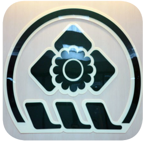
تحلیل این خبر را در ستون سمت راست بخوانید