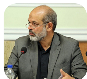
عضو مجمع تشخیص مصلحت نظام گفت: لایحه گروه ویژه اقدام مالی (FATF) هنوز در مجلس شورای اسلامی و این مجمع مطرح نشده است.

وجود ضعف و تضاد در قوانین در نقاط مختلف مبادرت که گاهی با اعمال سلیقه‌های فردی نیز تعبیر و تفسیر می‌شود، راه تخریب، رانت‌خواری، زدوبند و... را برای افراد و گروه‌های ویژه می‌گشاید و مسیر عمران و آبادانی و در نهایت پیشرفت و توسعه پایدار را سد می‌کند. رهاسازی میلیون‌ها هکتار زمین بلااستفاده در سطح کشور و نداشتن برنامه برای بهره‌گیری اصولی و منطقی از آنها از سوی دستگاه‌های متولی، هم به ممانعت از تولید ثروت و هم دامن زدن به بیکاری‌های روزافزون و فراگیر منجر شده و زمینه ویژه‌خواری را برای برخی فرصت‌طلب و سودجو فراهم کرده است. امروزه در کشورهای توسعه‌یافته، با ارائه خدمات رایگان و دادن یارانه‌های چشمگیر، مردم را تشویق و ترغیب به سرسبز کردن زمین‌های سنگلاخی حومه که با کلان‌شهرها می‌کنند و با برنامه‌ریزی‌های علمی و دقیق، هم به توزیع منطقی جمعیت