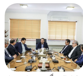
استاندار فارس گفت: شهرداری شیراز، طراحی و اجرای پروژه‌های شاخص در این کلان‌شهر را در دستور کار داشته باشد.

مدیریتی استان فارس در حقیقت، موفقیت مدیریت ارشد این استان تلقی می‌شود و به همین سبب ضرورت دارد که یک همراهی و هم‌افزایی دوسویه بین مجموعه استانداری و شهرداری شکل گیرد. وی، بیکاری قشر دانش‌آموخته و جوان را یکی از مدفوعه‌های اصلی جامعه برشمرد و گفت: یافت تاریخی شیراز از ظرفیت ایجاد بنگاه‌های مبتنی بر اقتصاد خلاق برخوردار است و می‌تواند در کنار دستیابی به هدف احیای زندگی در این بافت، بخشی از مدفوعه اشتغال را حل کند.