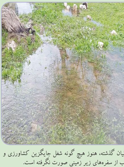
پریشان که در سالیان گذشته، هنوز هیچ گونه شغل جایگزین کشاورزی و کاهش برداشت آب از سفره‌های زیر زمینی صورت نگرفته است.

شروع به جوشش کند، چشمه‌ای که در شرق تالاب است و با آبدهی حدود ۶۰ لیتر بر ثانیه فعال شده است. وی گفت: اما مهم این است که در گذشته در حاشیه این چشمه بعضی افراد با نصب پمپ به صورت غیرمجاز آب برداشت می‌کرده‌اند، آبی که قطعاً تمام و کامل حق آب پریشان می‌باشد و در حال حاضر بسیار مهم است که محیط زیست با نظارت دقیق اجازه برداشت آب از مسیر چشمه به طرف تالاب ندهد زیرا ورود آب به تالاب و آبدار شدن بخش‌هایی از تالاب سود و منفعت عمومی برای اهالی و کشاورزان حاشیه تالاب دارد. وی ادامه داد: آبدار شدن شرق تالاب چند اثر مهم دارد یک آبدار شدن بخش‌های شرقی از گسترش جامعه گزها جلوگیری می‌کند دوم این که آبدار شدن باعث ایجاد چمن زارها می‌شود که هم ارزش اقتصادی و هم چشم‌انداز گردشگری برای مردم آن منطقه به ارمغان می‌آورد و سومین اثر زنده ماندن نی زارها و زیروم هایشان در بخش شرقی است. این فعال محیط زیست عنوان کرد: ما امیدوار هستیم که با ادامه این روند تا قبل از بهار حدود ۴۵۰ میلی متر بارندگی در منطقه داشته باشیم که با همین حدود بخش‌هایی از شمال و شرق تالاب آبیگری می‌شود و نقش چشمه نارنجی در این کار بسیار مهم است. کاظمینی بیان کرد: اما متأسفانه علیرغم تدوین طرح جامع مدیریت تالاب