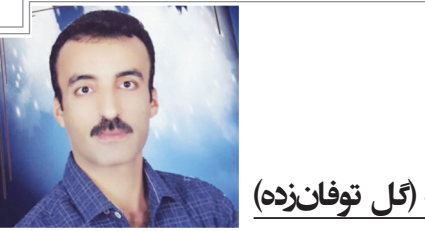
توانه (گل توفان زده)

دوباره می‌نویسم کنار بیت آخرم و چکه چکه می‌چمک به سطرهای دفترم تو تازیا به می‌زنی به زخمه خیال من من آب و دانه می‌دهم به خوش خیال باورم تو مثل ماه برکه‌ای و من غریق مست شب دوباره تو دوباره من شناوری شناورم شنیده‌ام ز پنجره سراغ من گرفته‌ای؟ هنوز مثل فاصدک میان کوچه پرپر گلایه از قفس کمی، کمی عجیب می‌رسد خودم قفس خریدم برای این کیوترم شبی بخواب دیدم میان تنگ کوچه‌ها قدم زنان قدم زنان، تو را به خانه می‌برم غزل بخواب می‌رود به انتها رسیده‌ام تمام من چکیده شد کنار بیت آخرم جلال خاوند