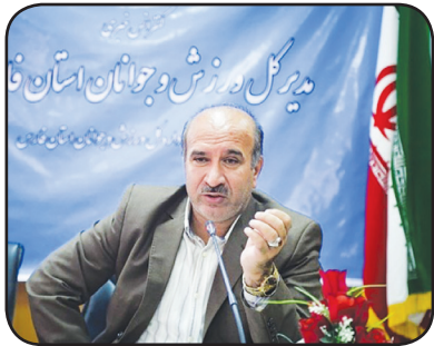
میرکل ورزش و جوانان استان فارس

مدیر کل ورزش و جوانان استان فارس گفت: هیئت سوار کاری استان فارس در برگزاری رویدادهای ملی و بین‌المللی در سال ۹۷ موفق عمل کرده و نمره قابل قبول گرفته است.