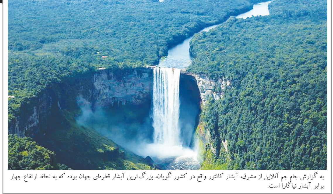
به گزارش جام جم آنلاین از مشرق، آبشار کاتتور واقع در کشور گویان، بزرگ‌ترین آبشار قطره‌ای جهان بوده که به لحاظ ارتفاع چهار برابر آبشار نیاگارا است.