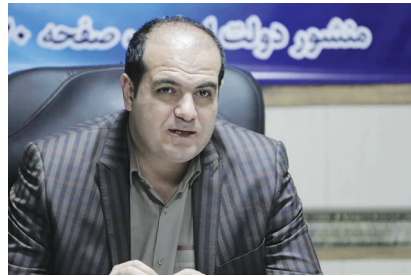
شیر ایرانی مانده؟ چون ما همه زیستگاه‌های کشور را تعیین داده‌ایم.

مدیر کل محیط‌زیست فارس تصریح کرد: زیستگاه‌های ما، تنوعی ندارند یعنی تنوعی که ضامن بقای گونه‌های جانوری و گیاهی باشد را ندارد.