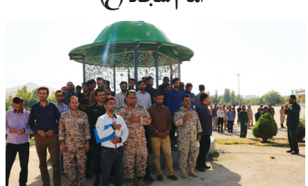
تپ تکلور امام سجاده (ع) انجام شد.

گزارش روزنامه طلوع به نقل از روابط عمومی و تبلیغات تپ تکلور امام سجاده (ع) به مناسبت نزدیک شدن به ایام آزادسازی خرمشهر در عملیات بیت‌المقدس، برنامه درس‌نامه دفاع مقدس با حضور پایوران و سربازان در حسینیه امام موسی بن جعفر (ع) تپ تکلور امام سجاده (ع) برگزار شد.