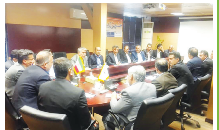
جلسه رفع مشکل حمل گندمهای خریداری شده در مراکز خرید گندم شهرستان کازرون