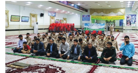
مراسم اکرام و محفل انس با قرآن در تپ تکلور امام سجاده (ع)

به گزارش روزنامه طلوع به نقل از روابط عمومی و تبلیغات تپ تکلور امام سجاده (ع) مراسم اکرام با حضور سربازان، جمعی از هیئت‌رئیس فرماندهی و اعضا شورای اسلامی شهر کازرون در حسینیه امام موسی بن جعفر (ع) تپ تکلور امام سجاده (ع) برگزار شد.