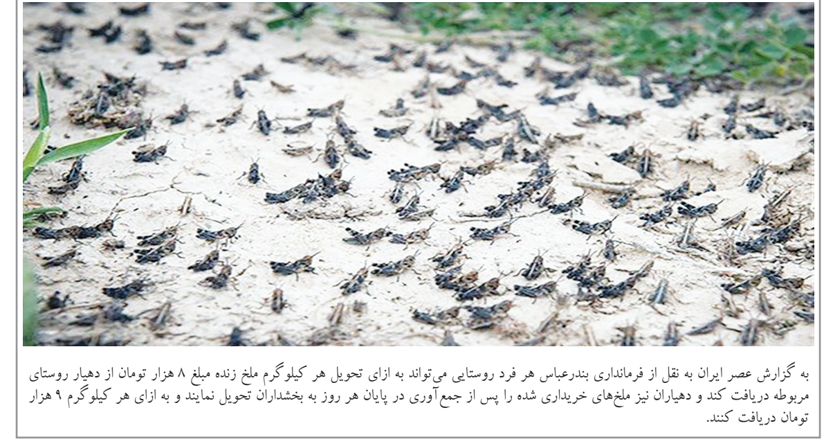
به گزارش عصر ایران به نقل از فرمانداری بندرعباس هر فرد روستایی می تواند به ازای تحویل هر کیلوگرم ملخ زنده مبلغ ۸ هزار تومان از دهیار روستای مربوطه دریافت کند و دهیاران نیز ملخ های خریداری شده را پس از جمع آوری در پایان هر روز به بخشداران تحویل نمایند و به ازای هر کیلوگرم ۹ هزار تومان دریافت کنند.