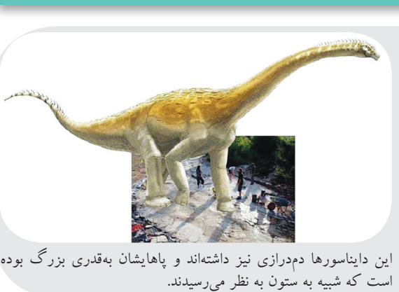
این دایناسورها هم‌درازای نیز داشته‌اند و باهایشان به قدری بزرگ بوده است که شبیه به ستون به نظر می‌رسیدند.

یک روستا به نام (Plagne) در فرانسه و در کوهستان‌های جورا وجود دارد که در فاصله ۲۰۰ کیلومتری شرق شهر لیون واقع شده است. در این روستا مسیری کشف شده که یکسری رد پای گول‌پیکر در آن وجود دارد که قدمشان به ۱۵۰ میلیون سال قبل برمی‌گردد و مربوط به رد پای ساروپود (گونه‌ای از دایناسور) است. لست سکند: اتفاقاً کشف همین مسیر، منجر به روشن شدن اطلاعاتی در مورد نوعی دایناسور از گونه ساروپودها شده است که تا به حال ناشناخته بوده‌اند و به همین دلیل این مسیر کشف شده از اهمیت بسیار بالایی برخوردار است.