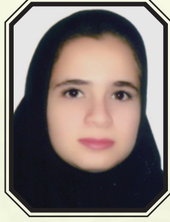
موسیقی تربیتی ویژه

دوره حکومت ساسانیان بالغ بر چهارصد سال به طول انجامید و این عصر را در میان اعصار تاریخ