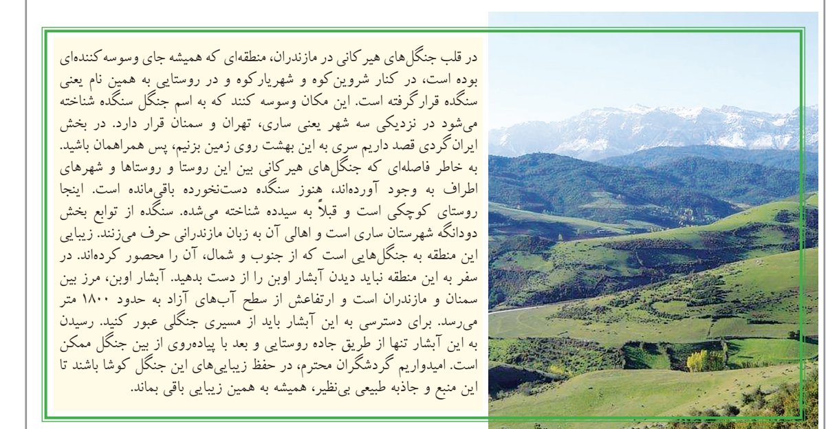
در قلب جنگل‌های هیرکانی در مازندران، منطقه‌ای که همیشه جای وسوسه‌کننده‌ای بوده است، در کنار شروین کوه و شهریار کوه و در روستایی به همین نام یعنی سنگده قرار گرفته است. این مکان وسوسه‌کننده که به اسم جنگل سنگده شناخته می‌شود در نزدیکی سه شهر یعنی ساری، تهران و سمنان قرار دارد. در بخش ایران‌گردی قصد داریم سری به این بهشت روی زمین بزنیم، پس همراهان باشید. به خاطر فاصله‌ای که جنگل‌های هیرکانی بین این روستا و روستاها و شهرهای اطراف به وجود آورده‌اند، هنوز سنگده دست‌نخورده باقی‌مانده است. اینجا روستای کوچکی است و قبلاً به سیده شناخته می‌شده. سنگده از توابع بخش دودانگه شهرستان ساری است و اهالی آن به زبان مازندرانی حرف می‌زنند. زیبایی این منطقه به جنگل‌هایی است که از جنوب و شمال، آن را محصور کرده‌اند. در سفر به این منطقه نباید دیدن آبشار اوین را از دست بدهید. آبشار اوین، مرز بین سمنان و مازندران است و ارتفاعش از سطح آب‌های آزاد به حدود ۱۸۰۰ متر می‌رسد. برای دسترسی به این آبشار باید از مسیری جنگلی عبور کنید. رسیدن به این آبشار تنها از طریق جاده روستایی و بعد با پیاده‌روی از بین جنگل ممکن است. امیدواریم گردشگران محترم، در حفظ زیبایی‌های این جنگل کوشا باشند تا این منبع و جاذبه طبیعی بی‌نظیر، همیشه به همین زیبایی باقی بماند.