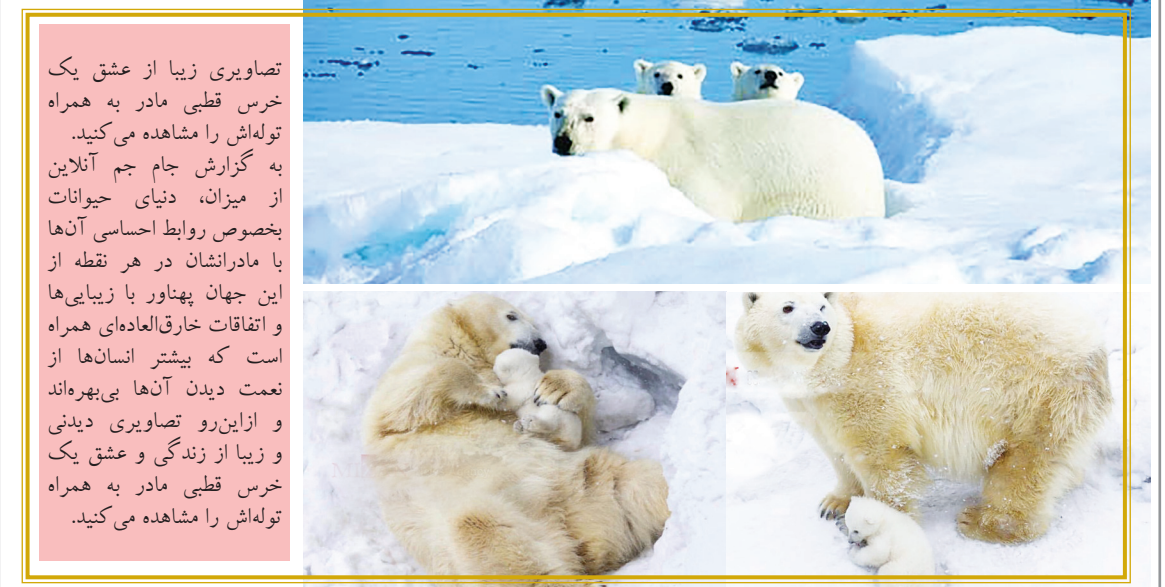
تصاویری زیبا از عشق یک خرس قطبی مادر به همراه تولدش را مشاهده می‌کنید. به گزارش جام جم آنلاین از میزان، دنیای حیوانات بخصوص روابط احساسی آن‌ها با مادرانشان در هر نقطه از این جهان پهناور با زیبایی‌ها و اتفاقات خارق‌العاده‌ای همراه است که بیشتر انسان‌ها از نعمت دیدن آن‌ها بی‌بهره‌اند و از این رو تصاویری دیدنی و زیبا از زندگی و عشق یک خرس قطبی مادر به همراه تولدش را مشاهده می‌کنید.