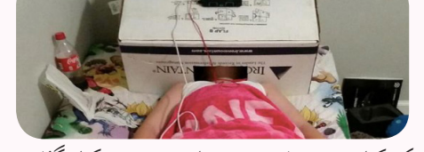
به سینمای اختصاصی من خوش آمدید!