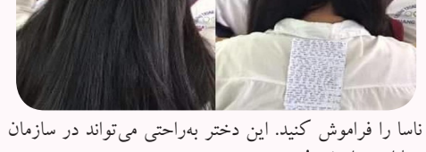
فکر می‌کنید چه چیزی را زیر موهای خود پنهان کرده‌است؟