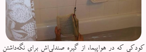
یک کتاب خوب را حتی در حمام هم نمی‌شود کنار گذاشت.