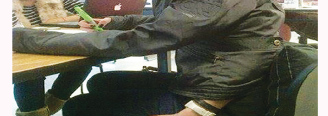
ناسا را فراموش نکنید. این دختر به راحتی می‌تواند در سازمان سیا استخدام شود!