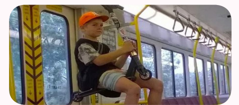
این جوری این پسر همیشه توی مترو، جا و اسه نشستن داره!

برترین‌ها: هرگز نباید بچه‌ها را دست کم گرفت. بسیاری از چیزهایی که ما امروزه در حال استفاده از آن‌ها هستیم، توسط کودکان اختراع شده‌اند. ترامپولین، کمدهایی که قفل آهن‌ربایی دارند، ماشین‌های اسباب‌بازی و بسیاری چیزهای دیگر، توسط کودکان اختراع شده‌اند. در ادامه با برترین‌ها همراه باشید تا کودکانی را ببینیم که با نبوغ خود، زندگی خود را راحت‌تر کرده‌اند.