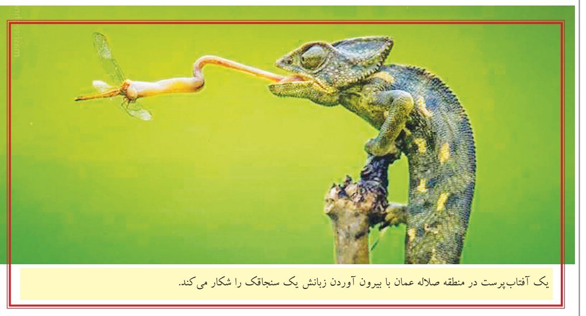
یک آفتاب پرست در منطقه صلاحه عمان با بیرون آوردن زبانش یک سنجاقک را شکار می کند.