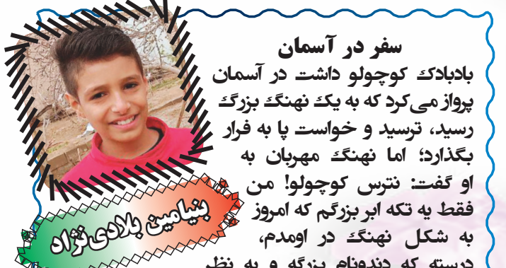
سفر در آسمان

لطفاً مطالب خود را با درج شماره تلفن به دفتر روزنامه یا آدرس الکترونیکی ذیل ارسال نمایید. ضمناً روزنامه در ویرایش مطالب ارسالی، آزاد است و مطالب ارسالی برگشت داده نمی‌شود. toloudaily@gmail.com کارشناس (این شماره) سرویس ادبی-هنری: صفورا کاظمی