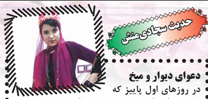
حکایت سحرآمیز منشی