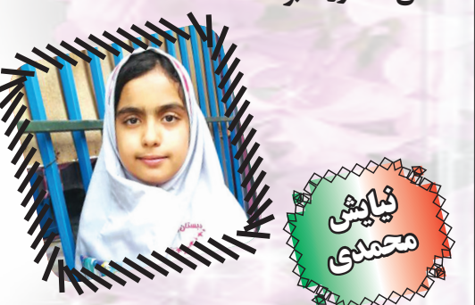
تلسکوپ و ستاره‌ها