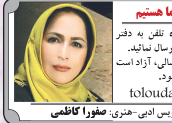
منتظر داستان و اشعار شما هستیم