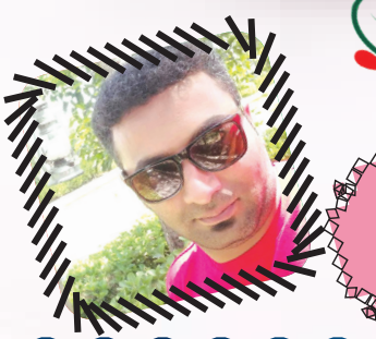
شعرا سیرین فروتنی