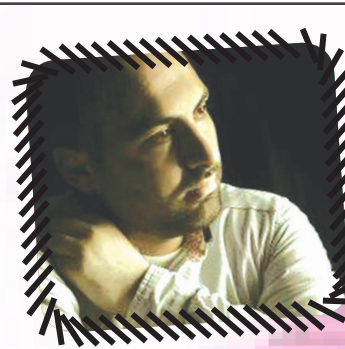
شعرا حنظله روانی