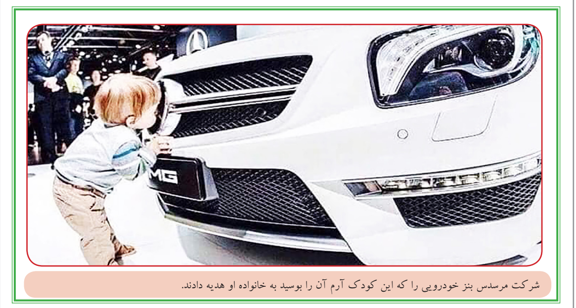
شرکت مرسدس بنز خودرویی را که این کودک آرم آن را بوسید به خانواده او هدیه دادند.