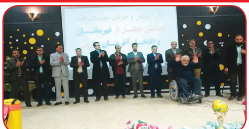
نوجوانان و جوانان مستعد و توانمند و هدایت آن‌ها دارد، اظهار داشت: در فاز دوم حفظ این جوانان و استعدادهاى برتر و حمایت آن‌ها برای رسیدن به تیم‌های ملی مهم است. حسن مسعودی توسعه ورزش همگانی را توسعه فرهنگی، اجتماعی و اقتصادی خواند و نخبگان ورزشی شهرستان اقلید اشاره و بر لزوم حمایت از جوانان و نوجوانان مستعد این شهرستان در پیشرفت در عرصه‌های مختلف از جمله ورزش تأکید کرد. گفتنی است در این آیین افضلی نماینده مردم اقلید در مجلس شورای اسلامی، عنایت‌الله بخارایی قهرمان پارالمپیک ۲۰۰۴ آتن، محمدرضا صلواتی مدیر روابط عمومی اداره کل ورزش و جوانان فارس، برخی از مسئولان محلی، روسا و نایب‌رئیسان هیئت‌های ورزشی، پیشکسوتان، مربیان، داوران، قهرمانان و خانواده‌های آنان حضور داشتند.