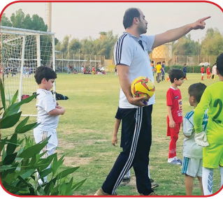
بدون تردید آنچه سبب داغ شدن تنور هر مدرسه فوتبالی می‌شود، بهبود کیفیت و کمیت بازیکنان رده‌های مختلف آن بوده که در کنار مربیان خود مراحل یادگیری فوتبال و پله‌های ترقی را یکی‌یکی طی می‌کنند. بیش‌ازحد خلوت بودن یک مدرسه فوتبال، ضمن ایجاد خسارت‌های مالی برای مدیران آن به جهت تحمل هزینه‌های فراوان ازجمله کرایه زمین، خرید وسایل کمک‌آموزشی، دستمزد مربیان و... در شرایط اقتصادی کنونی جامعه، سبب کاهش انگیزه سایر بازیکنان و مربیان نیز شده به گونه‌ای که نمی‌توان به‌تمامی اهداف آموزشی از پیش تعیین شده دست یافت. لذا باید پیش از آغاز هر ترم آموزشی، افرادی متخصص و با تجربه در امر تبلیغات و افزایش میل و رغبت خانواده‌ها جهت ثبت‌نام فرزندان‌شان در کلاس‌های آموزشی آن مدرسه فوتبال، با همکاری مدیران مربوطه در استخدام مربیان شناخته شده و مورد تأیید انظار فنی و اخلاقی، عقد قرارداد با زمین چمنی که راه دسترسی به آن آسان بوده، تخفیف برای بازیکنان

کم‌بضاعت و مستعد و معرفی بازیکنان نخبه به تیم‌های باشگاهی معروف در رده‌های مختلف، سبب دلگرمی بازیکنان و خانواده‌ها شده به گونه‌ای که ثبت‌نام به میزان کافی و نه بیش‌ازحد صورت گرفته و موجبات رونق اقتصادی آن مدرسه فوتبال و مهمتر از آن افزایش بار آموزشی خواهد شد. آنچه در امر بازاریابی یک معضل و چالش بزرگ محسوب می‌شود، دروغ‌گویی و وعده وعیدهای پوچ و ناممکن به جهت اغفال خانواده‌ها در جهت افزایش میل به ثبت‌نام است که موجبات خشم، نارضایتی و در نهایت کاهش اعتبار آن مدرسه فوتبال در ترم‌ها و مقاطع آتی را به دنبال خواهد شد. ازجمله این وعده‌های پوچالی در برخی مدارس فوتبال عمدتاً سطح پایین، معرفی بازیکنان به رده‌های مختلف تیم‌های ملی کشور و باشگاه‌های معتبر اروپایی ازجمله ریال، بارسلونا، منچستر یونایتد و... است. حال آنکه بعضاً مدیران آن مدارس فوتبال از انجام یک بازی دوستانه ساده با سایر مدارس فوتبال نیز عاجز و درمانده‌اند؛ اما در حال حاضر بهترین شیوه تبلیغات از طریق رسانه‌ها و خصوصاً فضای مجازی (واتساپ، تلگرام، اینستاگرام و...)، نصب پارچه و بنر به صورت گسترده در سطح شهر و اماکن شلوغ خصوصاً ورزشگاه‌ها و مهمتر از همه خوشامی و اعتبار نام مدیر و مربیان آن مدرسه فوتبال به جهت پرورش استعدادها و تحقق مقاصد آن مدرسه از پیش داده شده به خانواده‌ها است.