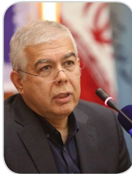
وی با اشاره به افتتاح نمایشگاه عرضه و تقاضای فناوری از روز ۲۶ آذر اظهار کرد: از اولیای مدارس

درخواست می‌شود دانش‌آموزان را برای بازدید به این نمایشگاه که در محل دائمی نمایشگاه‌های بین‌المللی است، ببرند. برآمدن، هدف‌گذاری کشور را بر توسعه اقتصاد دانش‌بنیان دانست و خاطرنشان کرد: این هدف محقق نخواهد شد، مگر آنکه بر روی نیروهای انسانی سرمایه‌گذاری شود، از این‌رو بازنگری در زمینه آموزش و پرورش امری ضروری است.