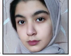
دنیا عجب دلی دارد

چه طاقتی دارد وقتی هر روز شاهد غم و اندوه عده ای و زشتی و پلیدی رفتارهای عده ای دیگر است و چه صورانه چشم می بندد. وقتی هر لحظه شاهد کودگانی است که از گرسنگی جان می سپارند و دم نمی زنند. بیمارانی که درد می کشند و جنگ زدگانی که شاهد مرگ عزیزانشان هستند و فریادشان را در گلو خفه می کنند. دنیا باید دلش قدر دنیایی باشد تا این همه غم را در خود جای دهد و دم بر نیآورد. به راستی این دنیا عجب دلی دارد!