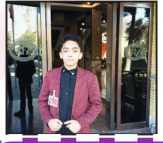
لاک پست پوزه عقابی

ضربان خسته قلب، شبها معادله گنگ نبودت در سرم رعدوبرق به پا می کند. خاطرات را با بغض ببند. نمی خواهم در کهکشان آسمان حافظه ام ستاره ها چشمک می زنند و من خیره به دورترین ستاره کم نورم. تو را نمی دانم ولی من شعر شدن را بلد نیستم. گاهی فقط طی می کنم روز را به امید شب. تو از سواد عشق چتر بی باران را باز کرده ای و من مدت هاست که با فکر