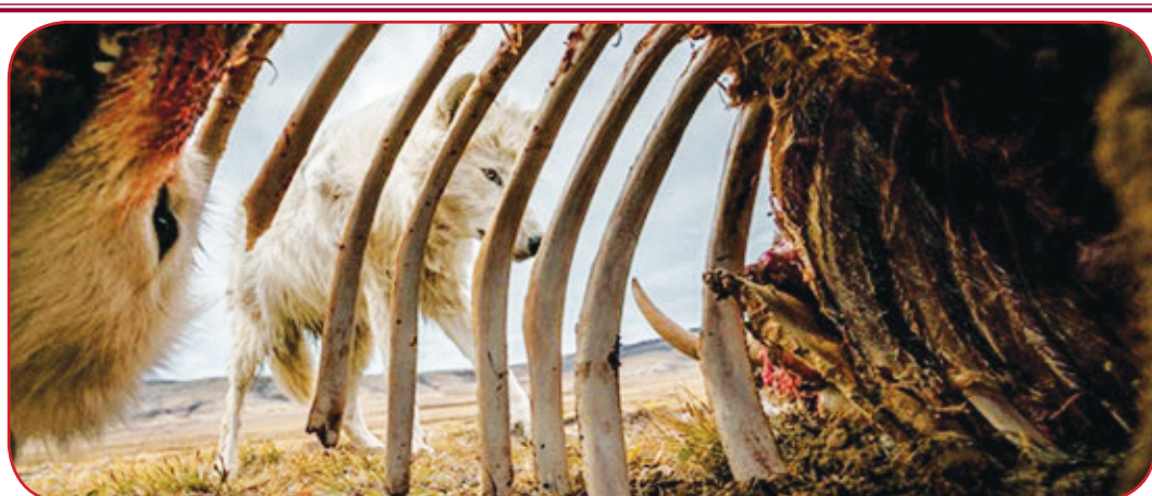
گرگ‌ها در قطب شمال کانادا بقایای یک گاو‌مشک را می‌خورند. ژنان دُنوان برای گرفتن این عکس دوربین خود را در داخل جسد کار گذاشت. گله یک ماه برای خوردن گاو‌مشک می‌آمدند و می‌رفتند.