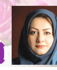
از تبار شالیزار

مستم از این شگرد دلبری‌ات، محو و شاگرد ناز چشمانت کاسه‌ی صبرم از تالطم تو، پر شده بی شکب می‌جوشد دختر کوه و جنگل و دریا، کولی عاشق حمیرایی چشمه‌ای از ترقصی ساده، در شمال عنقریب می‌جوشد در شمالی‌ترین رؤیاها می‌شوی همسفر به بال نسیم