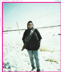
پانته آ گلپر

زندگی من از ازل تار است سرنوشتی که سنگ خواهد شد یا که بی تو به مرگ مجبورم دل برای تو تنگ خواهد شد نیستم لایقت که می‌دانم باید از تو گذشت آرامم باید از تو غریب دل بکنم تا ابد دوست ولی دارم ناخدای غریب دریایم تو خدای جهان من بودی از تو تا من هزار فرسنگ است یوسفم بوی پیرهن بودی ظالم مهربان اشعارم چشم‌هایت جهان زیباییست من برایت هنوز می‌میرم خنده‌های پسته‌های کرمانیست یار تازه رسیده‌ام برگرد بی تو در اشتباه می‌مانم اگر از تو خبر نباشد یار شاعری بی‌پناه می‌مانم نازنینم بخند می‌دانی؟ خنده‌هایت دوا می‌دهد درد است یخ‌زده روزگار تنها ییم بی تو حتی بهار هم زرد است