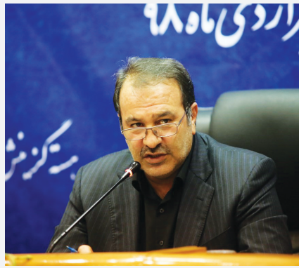
به‌سختی امسال نبوده و فشارها و تنگناهای موجود به‌ویژه در حوزه اقتصادی باید موردتوجه باشد.