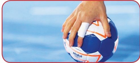
دریایی تهران و شهید شاملی کازرون به ترتیب در رده‌های اول تا سوم جدول رده‌بندی قرار دارند.

تیم هندبال بانوان شهید شاملی کازرون مقابل ذوب‌آهن اصفهان به برتری دست یافت. به گزارش روزنامه طلوع به نقل از روابط عمومی و پایگاه خبری و اطلاع‌رسانی اداره کل ورزش و جوانان فارس به نقل از خبرگزاری صداوسیما، مرکز فارس، در