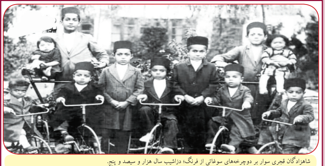
شاهزادگان قجری سوار بر دوچرخه‌های سوغاتی از فرنگ؛ دزاشیب سال هزار و سیصد و پنچ.