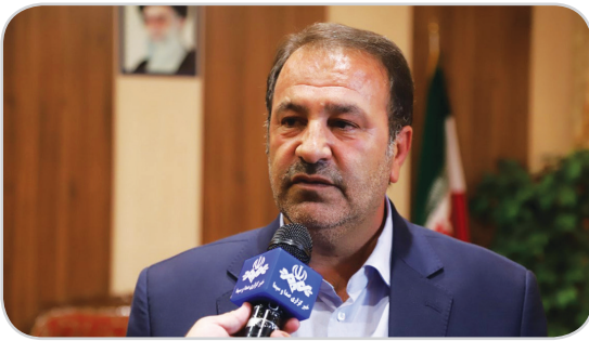
دستور کار قرار دهند.

استاندار فارس با بیان اینکه از مرحله عادی مواجه با کرونا ویروس عبور کرده‌ایم و به مرحله درگیری با این بیماری وارد شده‌ایم عنوان کرد: در این زمینه همکاران در علوم پزشکی شیراز با توجه به سه سناریویی که طراحی شده است اقدامات لازم را انجام می‌دهند. دکتر رحیمی بر لزوم توجه به ضدعفونی مکان‌های عمومی و ناوگان حمل‌ونقل عمومی و درون‌شهری با همکاری شهرداری و علوم پزشکی تأکید کرد و خواهان تداوم اقدامات شد که در روزهای گذشته در این زمینه انجام شده است. اطلاع‌رسانی دقیق درباره راه‌های مقابله با انتشار ویروس کرونا از طریق بیلبوردهای شهری، صداوسیما و سایر رسانه‌ها از دیگر موضوعاتی بود که استاندار فارس در این جلسه به آنها تأکید کرد. نماینده عالی دولت در استان فارس همچنین از دستگاه‌های اجرایی، فرهنگی و مذهبی خواست لغو تجمع‌های غیرضروری را در