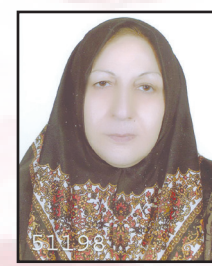
شریعت ادیبی «ادیبه»

کنجینه ای به معنا قلب را سکتینه‌ای با تو دارم الفت دیرینه‌ای در مراعت نیست ترکِ دوستان در ضیافت باده‌ای بی کینه‌ای گویی سبقت را ربودی در زمین در میناعت از ملک بیشینه‌ای نام دیگر بر رفاقت داده‌ای در صداقت برتر از آئینه‌ای می‌نگنجد هر کس در سینه‌ام جز تو ناممکن بر این دل پینه‌ای همجو گنجی دارم در کنج دل گنج پنهانی مرا در سینه‌ای گنج بسیاری اگر باشد مرا پیش مستان بهترین گنجینه‌ای