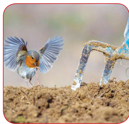
عکس‌هایی که در رقابت‌های ملی و بین‌المللی ۲۰۱۸ برنده جوایز بهترین عکاسی شده‌اند را ببینید.