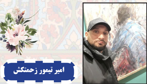
امیر تیمور زحمتکش