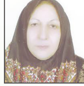
شریعت ادیبی «ادیبه» شیراز

حروف آشفته بودند و ناآرام با پوست کردن شروع شد پرتقال کوکی در چشم حروف حرفی نداشتند خیره و خسته به گذر زمان از خروس افتاده بود روز که شب از پلک‌ها بالا رفت یک خط کشیدنی یک خط روی شیشه میز برای پرده بینی فرقی نداشت چقدر حروف از دهان ما خسته می شدند تا بازوهایمان را از آنها خط خطی می کردیم چه مردن لذت داشت بعد از لب‌سوزی سیگار عوض تمام حرف‌های خسته پاهای دراز شب و پلک‌هایم هیچ خطی نمانده از لب شب تا خروس روز!