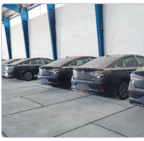
فرمانده انتظامی استان بوشهر گفت: مأموران پلیس امنیت اقتصادی یک انبار خودروهای خارجی بدون پلاک را در این استان را شناسایی کردند.

به گزارش ایرنا، سردار خلیل واعظی در جمع خبرنگاران افزود: در این انبار هشت دستگاه خودرو خارجی از نوع سوناتا به ارزش ۱۰ میلیارد تومان نگهداری می‌شد. وی بیان کرد: با بررسی‌های صورت گرفته، مشخص شد این خودروها سال ۹۶ از امارات وارد کشور و اوایل سال گذشته از گمرک ترخیص شده است. واعظی، مدت زمان نگهداری این خودروها در انبار را ۱۵ ماه عنوان کرد.