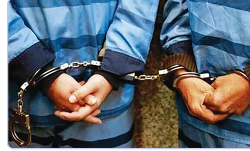
رئیس مرکز عملیات پلیس امنیت عمومی پایتخت از شناسایی و دستگیری ۴ عضو باند جاعلان مدارک تحصیلی که به صورت شبکه‌ای در نقاط مختلف کشور مدارک تحصیلی جعل می‌کردند خبر داد.

کار قرار دادند. وی توضیح داد: شاکی اظهار داشت، فردی در بد دست داشتن گواهی موقت پایان تحصیلات دوره پیش‌دانشگاهی درخواست تأیید اصالت مدرک مذکور را داشته را کرده است، ولی در بررسی ارکان و اصالت مدرک مشخص شد مدرک جعلی و فاقد اصالت است. این مقام پلیسی ابراز داشت: با توجه به حساسیت موضوع، مأموران پس از انجام تحقیقات فنی دریافتند فرد موردنظر بدون اینکه در جلسات کلاس‌های درسی و امتحانات شرکت کند از طریق آشنایی با یک جاعل مدرک تحصیلی جعلی را در قبال پرداخت وجهی تحویل گرفته و برای تأیید گواهی موقت به یک از نهادهای دولتی مراجعه کرده است.