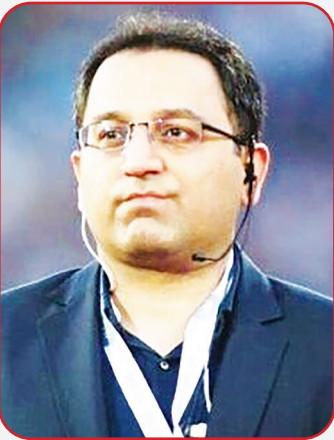
سخنگوی فدراسیون فوتبال گفت: میزان ایرادهایی که فیفا به کلیت اساسنامه گرفته، به تعداد انگشتان دو دست هم نمی‌رسد.

وی با اشاره به اعلام زمان آغاز تمرینات و مسابقات فوتبال باشگاهی عنوان کرد: سازمان لیگ فوتبال ایران با توجه به پروتکل‌های منتشر شده بهداشتی از سوی فیفا، کنفدراسیون فوتبال آسیا و ستاد ملی مبارزه با کرونا برنامه زمان آغاز تمرینات و شروع مسابقات را مشخص کرده و دستورالعمل‌های مرتبط با این شیوه‌نامه‌های بهداشتی نیز اجرا خواهد شد. اشخاص حقیقی و حقوقی نیز با رعایت الزامات قانونی و از