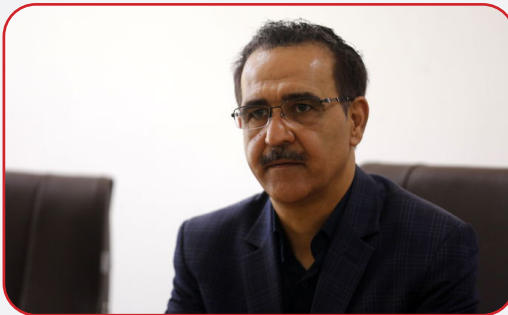
معاون فرهنگی و امور جوانان اداره کل ورزش و جوانان فارس از راه‌اندازی دبیرخانه دائمی فرهنگ پهلوانی (ورزش زورخانه‌ای) در شیراز خبر داد.