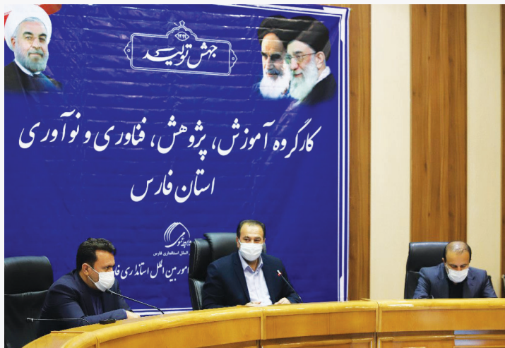
استاندار فارس گفت: باید کمیته‌ای علمی برای عملی کردن نتایج تحقیقات و پژوهش تشکیل زندگی مردم باشیم.

نماینده عالی دولت در استان فارس تلاش در تأمین سه مقوله معیشت، سلامت و امنیت را ازجمله اهداف دولت تدبیر و امید در سال جاری عنوان کرد و اظهار داشت: باید کمیته‌ای علمی برای عملی کردن نتایج تحقیقات و پژوهش تشکیل شود تا شاهد اثرگذاری در بخش‌های مختلف زندگی مردم باشیم.