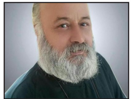
کیهان ژولیده انارکی