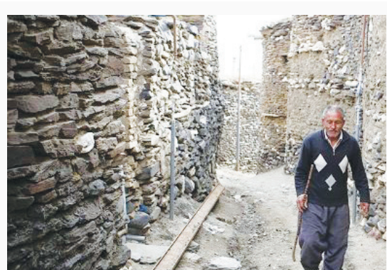
به گزارش ایسنا این خبر پیرامون مرثیه‌ای برای روستای رنسانسی ایران برای شما همراهان نگارش شده است.