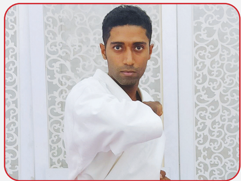
کاراته کاهای هرمزگانی هفت نشان اول تا سوم مسابقه مجازی قهرمانی کاراته (E-KARATE) جهان در بخش کاتا را کسب کردند.