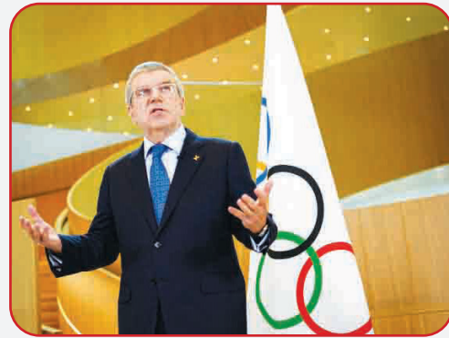
رئیس کمیته بین‌المللی المپیک گفت: تولید واکسن کرونا یک راه حل جادویی برای برگزاری بازی‌های المپیک توکیو نخواهد بود و فقط آن را تسهیل می‌بخشد.

رئیس کمیته بین‌المللی المپیک لزوم نشان دادن همستگی ورزشکاران در این شرایط تأکید کرد: اگر برای اطمینان از امن بودن یک محیط برای همه شرکت‌کنندگان در بازی‌ها به قرنطینه نیاز است، پس باید قرنطینه کنید و این مسوولیت برای همه است و هیچ کس نمی‌تواند فقط به دیگری نگاه کند و بگوید، من این را نمی‌خواهم، شما باید همستگی خود را نشان دهید.