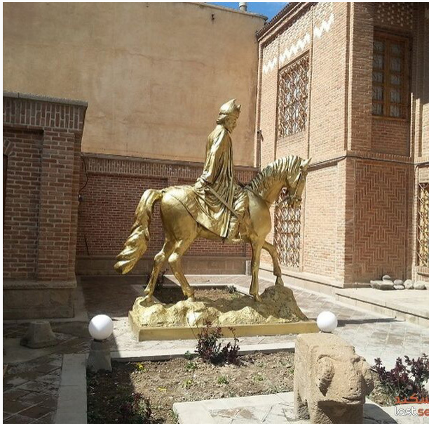
معرفی عمارت سیف العلماء

شما را بیشتر با این عمارت زیبا آشنا کنیم. عمارت سیف العلماء عمارت سیف العلماء در دو طبقه و با نمای آجری رو به جنوب احداث شده است. مصالح بکار رفته در آن چوب، آجر و خشت است. شاید بتوان عنوان کرد که بنای این عمارت با الگوبرداری از مسجد اسماعیل بیگ بناب که مربوط به دوره صفویه بنا شده است. قسمت تحتانی پایه ستون‌ها بصورت مربع و قسمت تکیه گاه ستونهای چوبی بصورت دایره کار شده که وسط آن حفره‌ای جهت نشست ستونها قرار گرفته است. ایوانی که در جلوی این عمارت است چهار ستون که با پایه‌های سنگی درست شده است دارد. این خانه در دو طبقه ساخته شده است. عمارت سیف العلماء در وسط باغ بزرگی قرار دارد که تماماً در اضلاع چهارگانه آن پنجره‌های کوچکی جهت تهویه و روشنایی استفاده می‌گردد. در گذشته در این عمارت باغ بزرگی وجود داشته اما امروزه به دلیل وجود خیابان شهید بهشتی ضلع جنوبی باغ را به دو قسمت تقسیم و اضلاع دیگر آن نیز بوسیله وراثت به قطعاتی تفکیک و به مرور زمان به واحدهای مسکونی و تجاری معاصر تبدیل شده است. در حال حاضر در قسمت شمالی ساختمان، باغ بزرگی هنوز وجود دارد. دیگر خصوصیت عمارت سیف العلماء سیستم روشنایی خاص آن است در داخل دیوارها می‌باشد. به این شکل که در داخل دیوار جایگاه‌های ویژه‌ای برای چراغ نفتی تعبیه شده است که از طریق دو جناح‌شعاعی در طرف جایگاه، باعث روشنایی فضای طرفین می‌شود. از طرفی در سقف جایگاه لوله‌ای برای تهویه هوای داخل جایگاه تعبیه شده است.