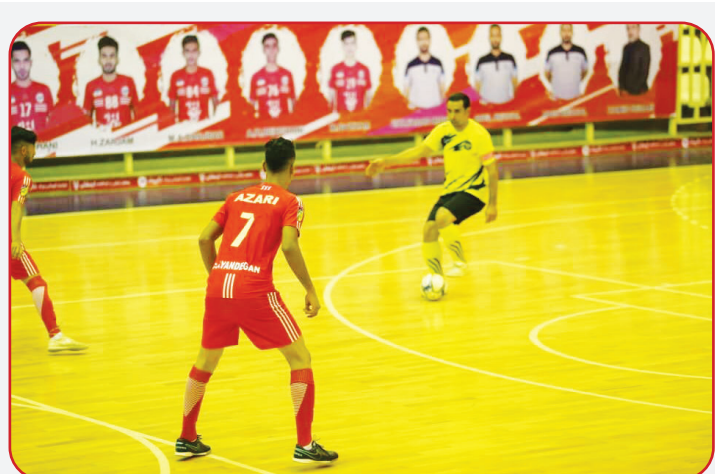
نماینده خوزستان شانس صعود به لیگ یک را دارد.

مسابقات فوتسال کشوری با شناخت تیم‌های برتر در ماهشهر به پایان رسید. به گزارش ایرنا مرحله نخست مسابقات فوتسال لیگ دسته دوم باشگاههای کشور به میزبانی ماهشهر برگزار شد که در پایان تیم خلیج فارس ماهشهر جواز حضور به مرحله بعد این مسابقات را دریافت کرد. این پیکارها با حضور تیم‌های خلیج فارس ماهشهر، جنرال ویند سقز، شهید قربانی اهواز، شهدای ایلام، چاپ معلم سنندج و همسفر لرستان از روز هشتم مه‌رامه به مدت پنج روز برگزار شد که در نهایت نماینده سقز به همراه تیم خلیج فارس عنوان اول و دوم را از آن خود کرده و به مرحله بعد صعود کردند. مرحله نخست مسابقات فوتسال دسته دوم باشگاههای کشور، در ۶ گروه برگزار شد که