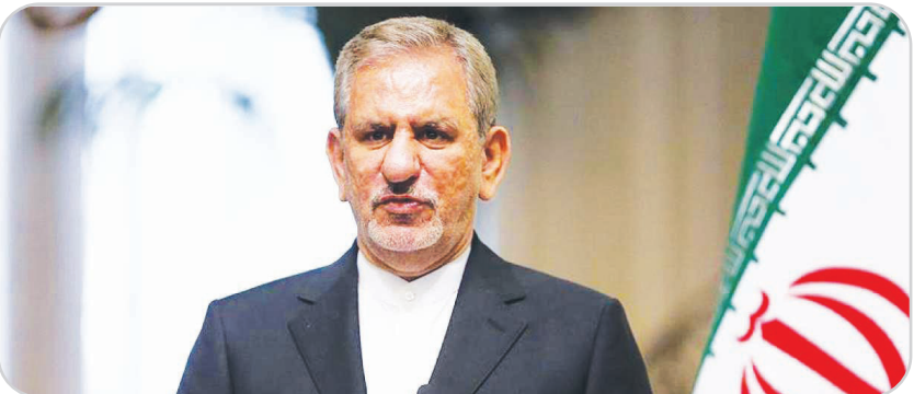
تحلیل این خبر را در ستون سمت راست بخوانید