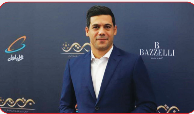
اقدام لازم طبق نظر کادر فنی صورت خواهد گرفت.

معاون اجرایی باشگاه پرسپولیس اعلام کرد که امکان جذب بازیکن در فینال لیگ قهرمانان آسیا وجود ندارد.