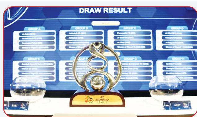
دیدار فینال لیگ قهرمانان آسیا ۲۰۲۰ در تاریخ ۲۹ آذر میان پرسپولیس و یک تیم شرقی در دوحه برگزار می‌شود.

یک رسانه قطری خبر داد کنفدراسیون فوتبال آسیا مانند فصل گذشته به دنبال برگزاری لیگ قهرمانان آسیا ۲۰۲۱ به شکل متمرکز و تک بازی است. به گزارش طرفداری، نشریه «الرایه» قطر خبر داد کنفدراسیون فوتبال آسیا قصد دارد مسابقات لیگ قهرمانان آسیا ۲۰۲۱ را هم مثل ساری جاری به صورت متمرکز و تک بازی برگزار کند. طبق گزارش‌های رسیده کنفدراسیون فوتبال آسیا با توجه به تداوم شرایط کرونایی قصد دارد دوباره وضعیت برگزاری به صورت متمرکز و تک بازی را تثبیت کند تا تیم‌ها برای سفر به کشورها دچار مشکل نشوند. لیگ قهرمانان آسیا ۲۰۲۰ به میزبانی دوحه برگزار شد و از منطقه غرب پرسپولیس به فینال راه پیدا کرد. مسابقات منطقه شرق هم اکنون در دوحه در حال پیگیری است تا فینالیست مشخص شود.