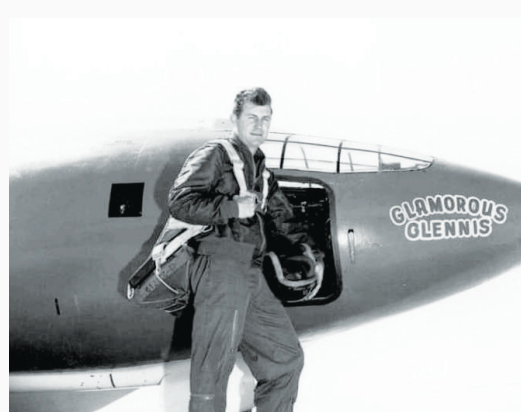
کالیفرنیا جنوبی خلبانی می‌کرد و به ارتفاع بیش از ۷ کیلومتری رسیده بود توانست با رسیدن به سرعت ۱۰۶۲ کیلومتر بر ساعت دیوار صوتی را برای اولین بار بشکند.

جالب اینجاست که علی‌رغم همه این موفقیت‌ها نداشتن تحصیلات دانشگاهی باعث شده بود که برای برنامه پرورش فضانوردان ناسا انتخاب نشود. به گزارش جام جم آنلاین چاک ییگر، خلبان آمریکایی که به عنوان اولین نفر توانسته بود دیوار صوتی را بشکند سرانجام در سن ۹۷ سالگی درگذشت. ویکتوریا ییگر در توییتر با اعلام خبر مرگ او در دوشنبه شب نوشته است که او یک زندگی فوق‌العاده خوب داشته است. ییگر که در جنگ جهانی نیز حضور داشته است به خاطر شرکت در تست‌های مختلف هوایی مشهور شده و به شجاعت در این زمینه معروف است. گفته می‌شود که شرکت او در این تست‌ها باعث هم‌اثر شدن راه مأموریت‌های فضایی آمریکا شده است. جالب اینجاست که علی‌رغم همه این موفقیت‌ها نداشتن تحصیلات دانشگاهی باعث شده بود که برای برنامه پرورش فضانوردان ناسا در اکتبر سال ۱۹۴۷ میلادی زمانی که هواپیمای X-۱ را بر فراز