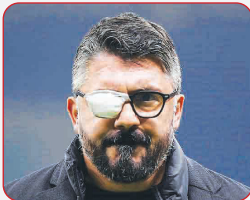
جنارو گتوزو سرمربی ناپولی در مورد بیماری خود و اینکه چرا یکی از چشمانش را می پوشاند صحبت کرد.

او ادامه داد: از علائم این بیماری، فقط تغییر در ظاهر چشم نیست؛ باعث خستگی چشم شما می شود و گاهی در ۲۴ ساعت، شب ها را دو تایی می بینید. فقط یک آدم دیوانه می تواند مثل من ادامه دهد. هر چه که هست، این زندگی من است و ممکن است در زندگی چیزهای بدتری هم وجود داشته باشد. همه چیز خوب است و اگر قرار است روزی بمیرم، دوست دارم در زمین فوتبال باشد؛ جایی که در آن زندگی کردم.