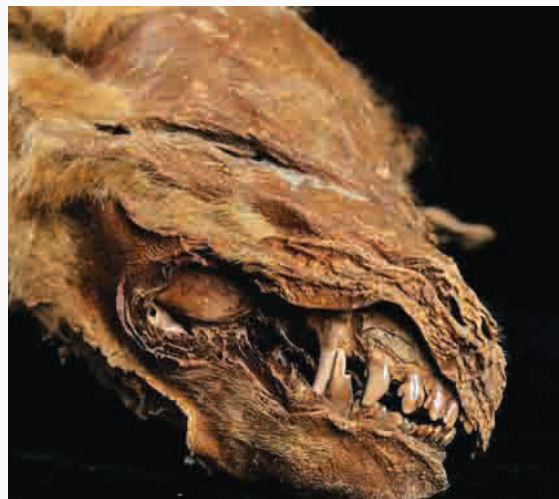
از تنگه برینگ، ۵۰ هزار سال پیش وارد آمریکا شدند.

کشف یک توله گرگ ۵۷ هزار ساله در کانادا به شدت توجه دیرینه شناسان را به خود جلب کرده است. به گزارش جام جم آنلاین به نقل از دیلی میل، یک توله گرگی که هزاران سال پیش مرده است در معدنی طلا در کانادا به طور اتفاقی پیدا شد. این اتفاق در یوکون، بخش شمالی کانادا رخ داده است. این توله گرگ تقریباً سالم است و سر، دم، پنجه و پشم دارد. تحقیق بر روی این توله گرگ نشان داده که ماده و در زمان مرگ هفت هفته‌ای بوده است. این توله گرگ بعد از مرگش کاملاً بیخ زده و ۵۷ هزار سال در همان حالت باقی مانده است. پیدا شدن جانوران چند هزار ساله در سبیری اتفاقی معمول است اما پیش از این چنین چیزی در شمال کانادا رخ نداده بود. این توله گرگ قدیمی‌ترین جانوری است که در میان گرگ‌ها پیدا می‌شود. پس از منتشر شدن تصاویر این جانور به سرعت در فضای مجازی و سایر رسانه‌های جهان بازنشر شد و ۵۷ هزار سال بعد از مرگش به شهرت رسید. گرگ‌های نخستین بار در اوراسیا ظهور پیدا کردند و بعداً با عبور