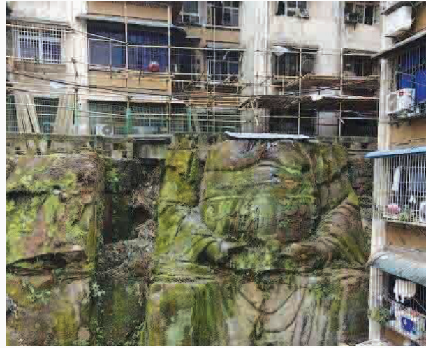
به گزارش ایرنا، براساس آخرین خبرهای بدست رسیده، کشف یک مجسمه غول پیکر بودا در چین صورت گرفت. یک مجسمه بودای غول پیکر و بدون سر بین دو ساختمان مسکونی در محله نانان شهر چونگ چینگ چین کشف شده است. این پیکره سنگی حدود ۹ متر ارتفاع دارد و براساس تخمین‌ها، قدمت آن به دوران دودمان چینگ برمی گردد.

مجسمه بودا در جریان عملیات جمع آوری و رفت و روب برگ‌ها پیدا شد. دو ساختمانی که این مجسمه در بین آنها کشف شد، در سال ۱۹۹۰ و پس از تخریب یک معبد در همان نقطه ساخته شدند. اغلب ساکنان ساختمان‌های مجاور از وجود مجسمه بی خبر بودند به جز یک نفر که می گوید ساخت این پیکره پس از تأسیس جمهوری خلق چین در سال ۱۹۴۹ متوقف شد. هنوز جوابی برای معمای جای خالی سر این مجسمه پیدا نشده است. این بودای غول پیکر تنها اکتشاف باستان شناسانه هفته‌های اخیر نیست که تیر رسانه‌های بین‌المللی شده؛ باستان شناسان به تازگی یک موزاییک متعلق به روم باستان را در انگلیس کشف کردند که معتقدند می‌تواند بر شناخت ما از دوران سیاه اثر بگذارد.