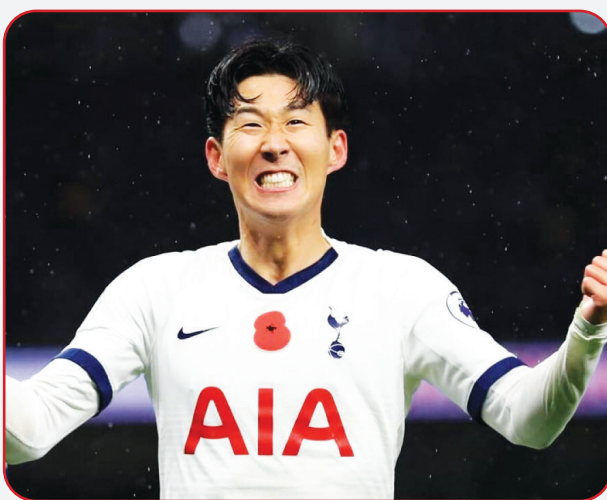
سون هیونگ مین ستاره کره‌ای تاتنهام به گفته یک خبرنگار ترکیه‌ای مورد توجه رنال مادرید قرار گرفته است.

حالا اکرم کونور، خبرنگار ترکیه‌ای ادعا کرده است که رنال مادرید در نظر دارد که با مدیران تاتنهام ملاقات کند تا جویای شرایط سون شود و این بازیکن کره‌ای را به خدمت بگیرد. این خبرنگار گزارش داده است که زین الدین زیدان با دقت شرایط جذب ستاره تاتنهام را دنبال می‌کند. سون در فصل ۲۰۲۰-۲۱ با چهارده گل و هفت پاس گل بی نظیر ظاهر شده است و طبیعی است که بخواهد جهشی را به سمت یک باشگاه بزرگ‌تر داشته باشد. او می‌تواند اولین آسیایی تاریخ رنال مادرید باشد. سون در حال حاضر در سایت ترانسفرمارکت ۹۰ میلیون یورو قیمت دارد که چهارمین بال به گزارش جام جم آنلاین به نقل از فوتبالی، سون در این فصل به