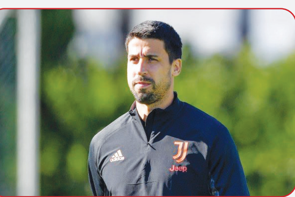
هافبک سابق تیم ملی فوتبال آلمان برای انجام مذاکرات نهایی با اورتون به انگلیس رفت.

او قبلاً در رنال مادرید و اشتوتگارت بازی کرده است. با تیم ملی آلمان نیز فاتح جام جهانی ۲۰۱۴ شد.