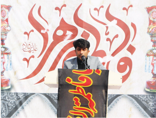
زمزمه‌هایی درخصوص فیلم مستند دیگری از گروه شما به گوش می‌رسد! موضوع چیست؟