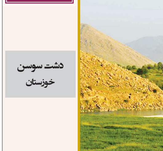
دشت سوسن خوزستان