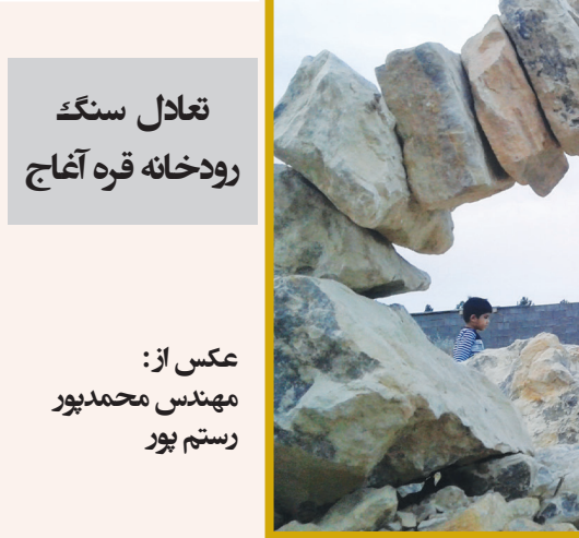
تعادل سنگ روdxانه قره آناج